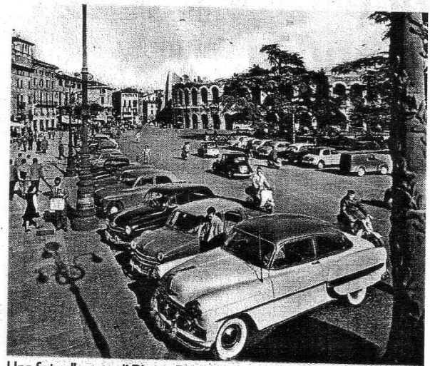
Una foto d'epoca di Piazza Bra con le auto parcheggiate sul Listòn